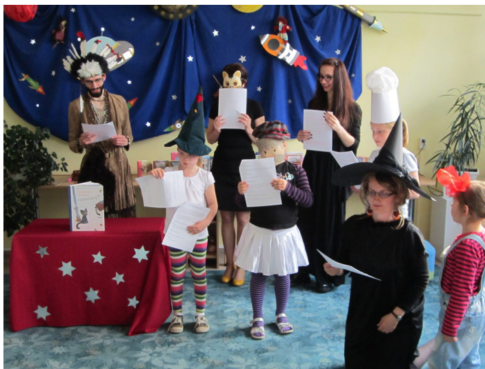
Noc Bibliotek w Filii nr 5, 2015 r.

W filiach odbyły się m.in.: otwarcie wystawy poświęconej Janowi Pawłowi II Szukałem Was, teraz Wy mnie znaleźliście ; przegląd kieleckich kronik filmowych z lat 1960-1970; Wieczór z szachami ; Detektyw w bibliotece ; Gwarowo wieczorowo ; Jak się cudnie żyło! – garstka wspomnień o PRL-u ; Wieczór baśni arabskich ; Wspomnień czar ; Uwaga! Na Uroczysku czarują! ; Nocne zabawy z detektywem Pozytywką ; Biblioteczna Noc Hobbysty ; Moje pasje ; Wolno czytać, wolno się bawić ; Wieczór gier ; Nocne granie z GryFikiem ; Lata 20, lata 30 ; Podróże marzeń – na dachu Afryki ; Gra planszowa to zabawa odlotowa .