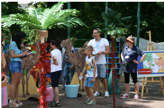
Gry i zabawy w Parku Miejskim, 2016 r.

Także poza sceną wiele się działo. Można było obejrzeć wystawy prac modelarskich i plastycznych, Giełdę zabawek używanych , wziąć udział w warsztatach plastycznych, ceramicznych, origami, happeningu artystycznym Etno-Europa , pokazach modeli pływających, a także zmierzyć się z najlepszymi w turnieju Na sto szachownic .