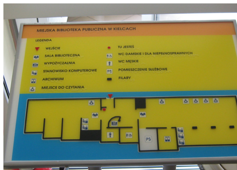
Specjalistyczny sprzęt dla osób niepełnosprawnych w Filii nr 9

Wśród kilku rodzajów sprzętu znajduje się urządzenie skanująco-czytające Multilektor Sara. Skanuje on wybrany tekst z książek i czasopism, a następnie przekazuje czytelnikowi w formie plików dźwiękowych. Umożliwia przeczytanie wielu dokumentów, poczty, broszur, artykułów oraz innych materiałów. Ogromną zaletą multilektora jest umiejętność rozpoznawania druku i odczytywania go wyraźnym i naturalnym głosem.