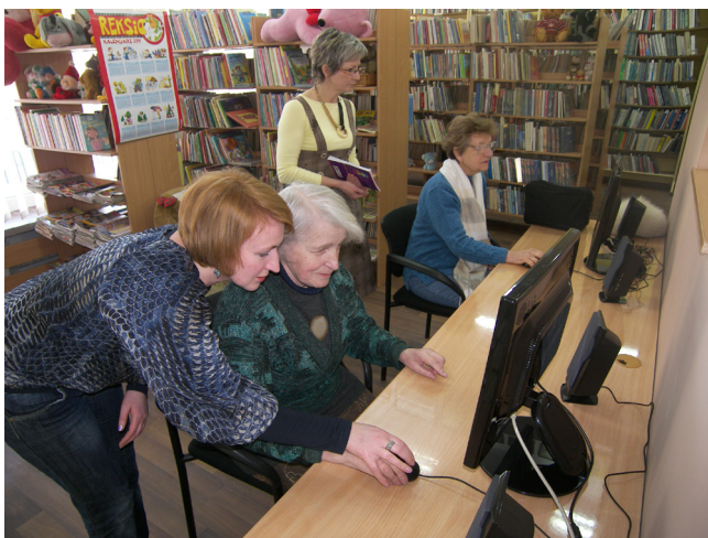
Internet dla seniora w Filii nr 12, 2011 r.

komputerowej. Pierwsze dni pracy w nowym systemie mogły przerażać niekończącymi się kolejkami, co początkowo kłóciło się z zakładanym usprawnieniem obsługi. Był to jednak stan przejściowy, związany z rejestracją kart bibliotecznych. Po kilku dniach sytuacja ustabilizowała się, a czytelnicy szybko przyzwyczaili się do nowej rzeczywistości. Wypożyczanie odbywa się odtąd w systemie MATEUSZ. Dzięki automatyzacji czytelnicy zyskali możliwość rezerwacji książek, zamawiania ich przez Internet, a także podglądu własnego konta i przeglądania historii wypożyczeń. Z ułatwień tych korzysta coraz więcej osób, także starszych. Większość z nich otrzymuje powiadomienia SMS-owe na telefon z informacją o terminie odbioru zarezerwowanych pozycji.