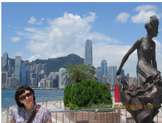
Hongkong – widok z Alei Gwiazd na Wzgórze Wiktorii, 2015 r.

Kolejnym punktem wycieczki był Kanton, miasto zwane również Guangzhou. Przykładem nowoczesnej budowl, będącej arcydziełem współczesnej architektury, jest bez wątpienia zwiedzana przez nas biblioteka miejska, oddana do użytku w czerwcu 2013 r. Usytuowana jest nad brzegiem Rzeki Perłowej i stanowi ośmiokondygnacyjny budynek wyglądający jak gigantyczny stos książek. Jej powierzchnia to prawie 100 000 m 2 , a wewnątrz przypomina ogromne centrum handlowe. Biblioteka jest bardzo przyjazna dla czytelników. Ogromne zasoby składające się z około 4 milionów woluminów są łatwo dostępne. Placówka posiada też zbiory prasy zagranicznej oraz literatury anglojęzycznej. W bibliotece znajduje się oddział dla osób niewidomych i słabowidzących, które mogą korzystać z około 4 tysięcy książek w alfabecie Braille'a. System biblioteczny ma technologię automatycznego sortowania RFID, co ułatwia sprawną pracę na terenie obiektu. Biblioteka w Kantonie liczy około 4000 miejsc i 500 komputerów. Jest ona nie tylko zbiorem książek, ale także miejscem wielu wydarzeń kulturalnych, m.in. wystaw sztuki.