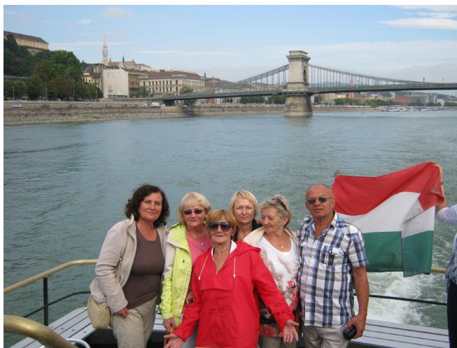
Rejs po Dunaju, 2015 r.

Następny dzień rozpoczęliśmy rejsem po Dunaju. W czasie przejażdżki statkiem mogliśmy na nowo podziwiać przepiękne zabytki usytuowane wzdłuż rzeki. Mieliśmy też okazję przyjrzeć się mijanym mostom. Wśród dziesięciu budapeszteńskich mostów, dwa są kolejowe, a po ośmiu można poruszać się pieszo bądź autem. Most Łańcuchowy, zdobiony czterema kamiennymi posągami lwów, jest najpiękniejszym mostem na Dunaju. Inne, zasługujące na szczególną uwagę, to Most Wolności, Most Elżbiety i Most Małgorzaty. Ostatni z nich prowadzi na wyspę o tej samej nazwie, która jest jednym z najbardziej popularnych terenów rekreacyjnych w mieście.