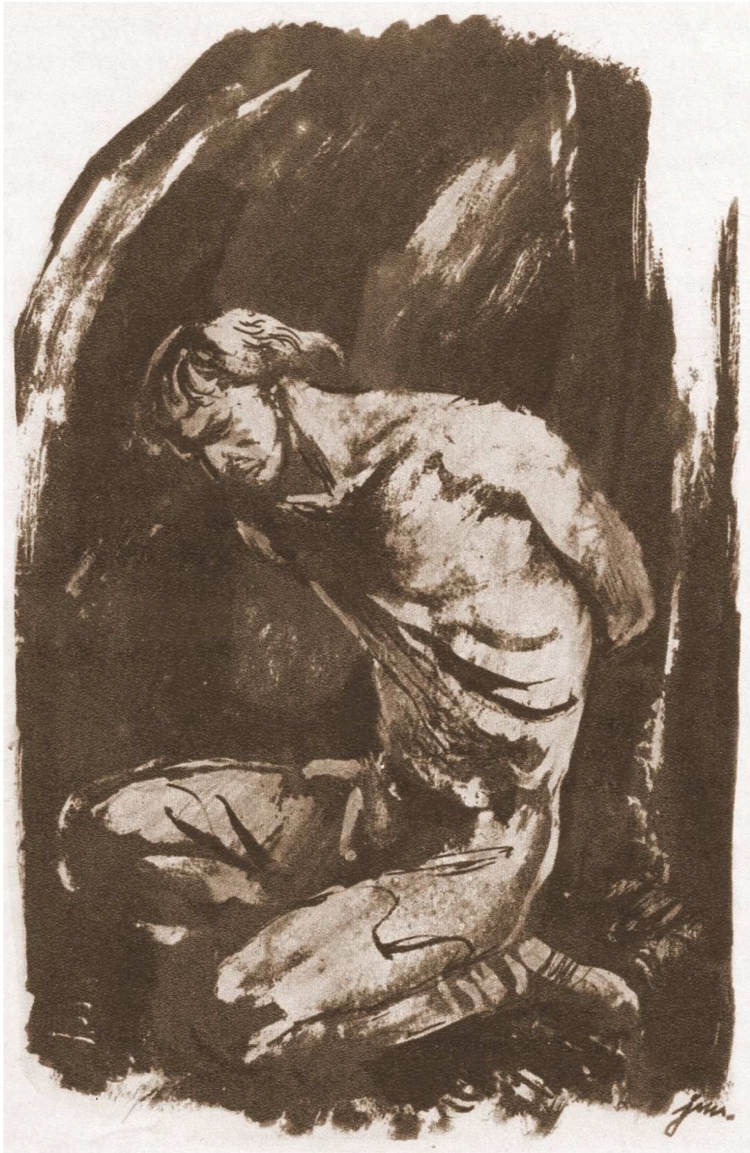
Jan Marcin Szancer, Ilustracja do Powieści o Udatym Walgierzu ( Duma o hetmanie i inne opowiadania , Warszawa 1957)