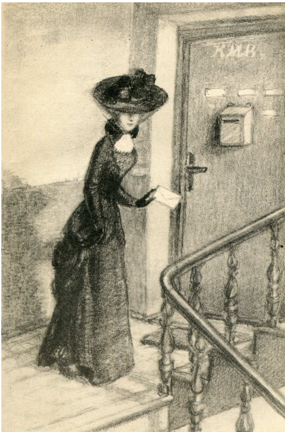
Monika Żeromska, Ilustracja do Dziejów grzechu . T. 1 (Warszawa 1956)