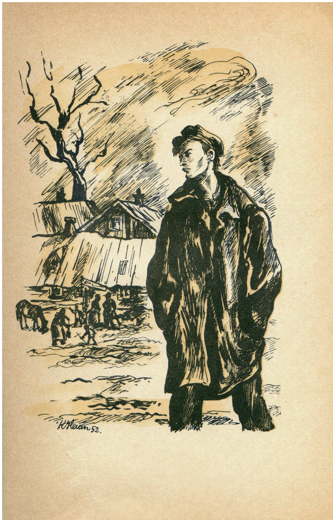
Krzysztof Henisz, Ilustracja do Przedwiośnia (Warszawa 1956)