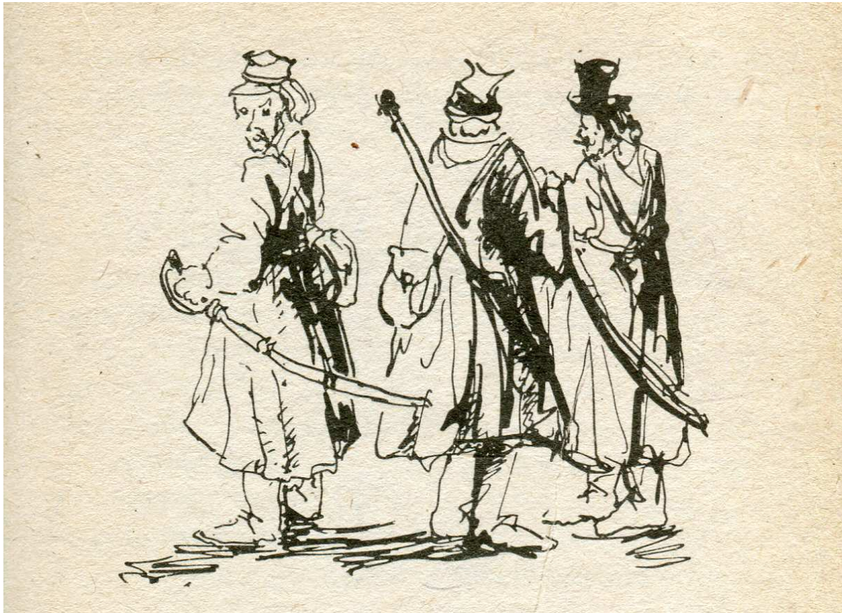
Janusz Szewczyk, Ilustracja do Ech leśnych (Łódź; Kielce 1985)