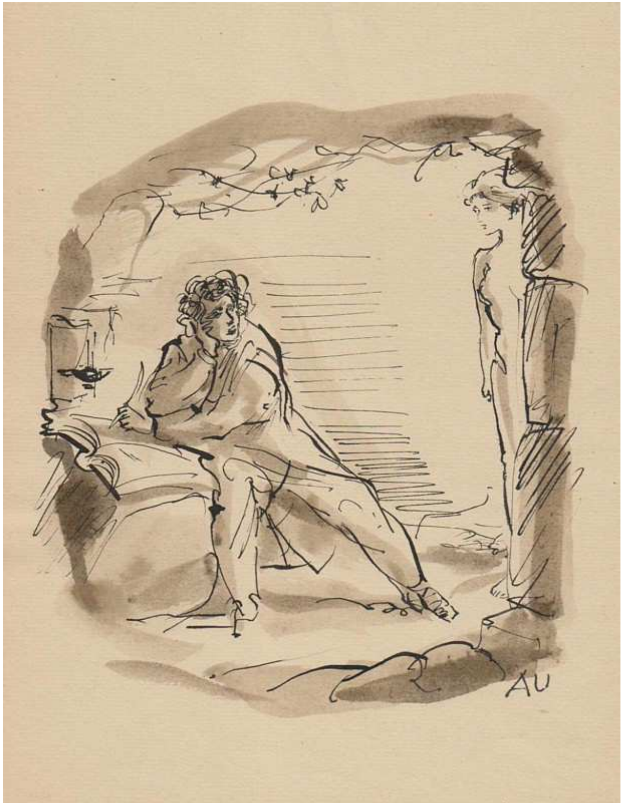
Antoni Uniechowski, Ilustracja do Popiołów pt. W domu pani Ołowskiej (kopia ze zbiorów Muzeum Narodowego w Kielcach, MNKi/Ż/169)