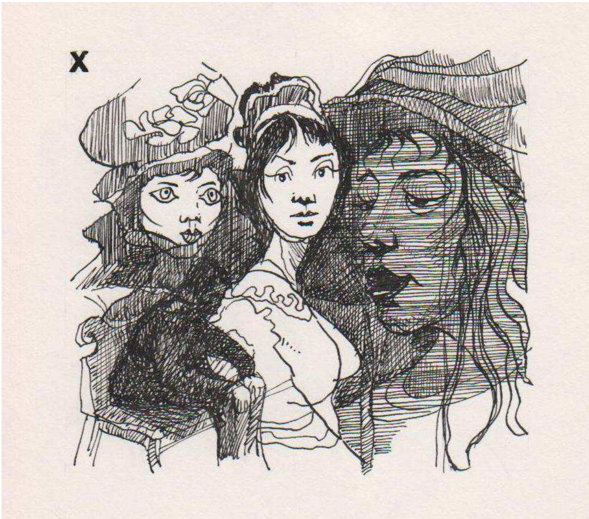
Henryk Papierniak, Ilustracja do Urody życia (kopia ze zbiorów Muzeum Narodowego w Kielcach, MNKi/Ż/555)