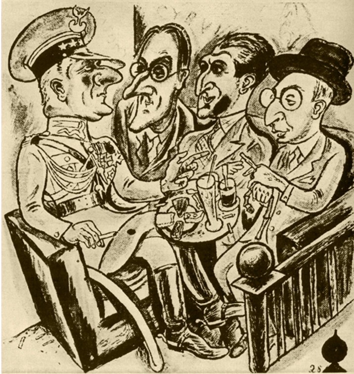
Rys. Władysław Daszewski ( Wiadomości Literackie 1928, nr 26)