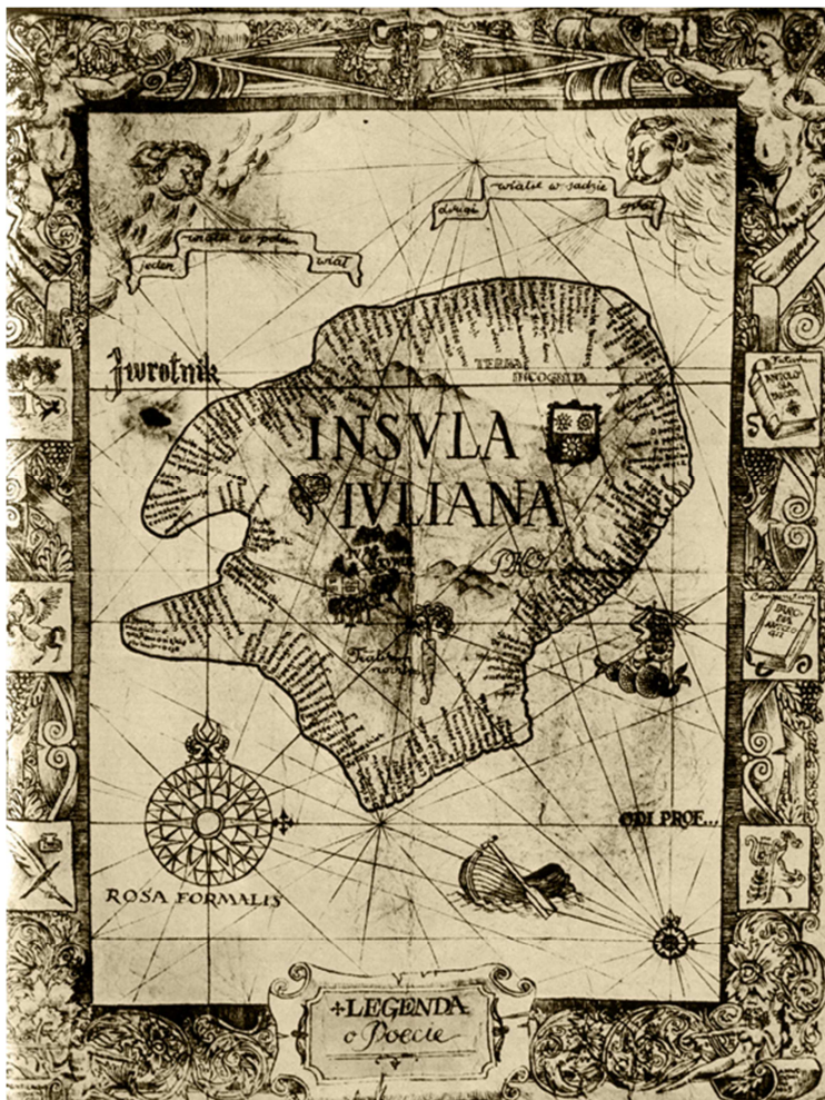
„Insula Iuliana” Rys. Szymon Kobyliński