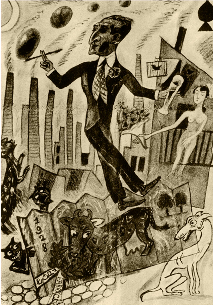
Rys. Władysław Daszewski ( Wiadomości Literackie 1928, nr 41)