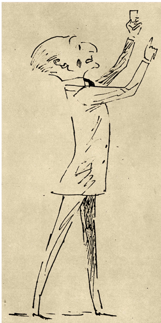
Rys. Jerzy Zaruba