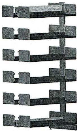
Rys. 2. regały dwustronne

II Wykonanie zamówienia nastąpi w terminie do 21 dni od daty podpisania umowy.